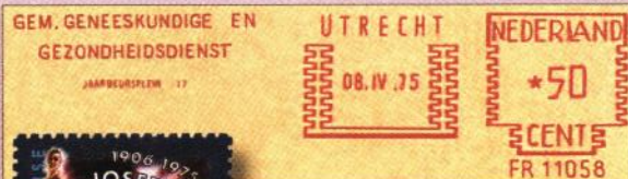
Boven: 6. De GGD Utrecht was niet bepaald blij met de jonge Sonneveld.