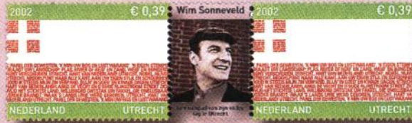
Links: 1. Wim Sonneveld 1917-1974