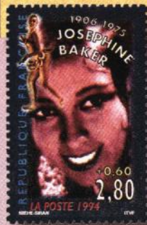
Links: 8. De Josephine Baker-imitatie was een van de eerste succesnummers van Wim Sonneveld.