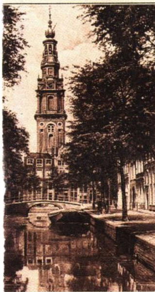
AMSTERDAM GROENBURGWAL Op den achtergrond toren van de ZUIDERKERK. Gebouwd door Hendrick de Keyser (1565-1621). De toren draagt het jaartal 1614. SERIE XI, NR. 1